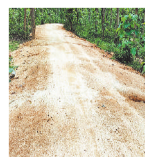
वही मुरुम की सड़क।

जिले के कई ग्रामीण क्षेत्रों में मुरुम सड़क के निर्माण में तय मापदंडों का पालन नहीं किया जाता है, जिससे कि निर्माण एजेंसियों के द्वारा जैसे-तैसे कार्य करा दिया जाता है और जब बरसात शुरू होती है, तब मुरुम सड़क के निर्माण गुणवत्ता की पोल खुल जाती है।