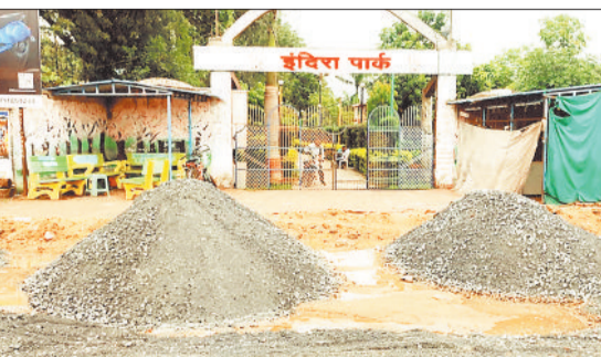
पार्क के सामने गिरा निर्माण सामग्री।

शहर के किनारे छोर पर स्थित गेज नदी पर लाखों की रूपए की लागत से नया पुल का निर्माण कार्य कराया जा रहा है। निर्माण एजेंसी की लापरवाही के कारण उच्च स्तरीय पुल निर्माण कार्य तय समय में पूरा नहीं हो पाया है। जानकारी के अनुसार गेज नदी पर उच्च स्तरीय पुल का निर्माण कार्य तो पूरा कर लिया गया है, लेकिन पुल के दोनों ओर एप्रोच सड़क निर्माण कार्य शेष है, इसमें और समय लग सकता है। पुल के एक ओर एप्रोच सड़क बनाने के लिए खुदाई कर दी गई है। मुख्य