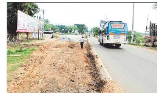
बनाई जा रही एप्रोच सड़क।

सड़क किनारे से ही एप्रोच सड़क का निर्माण कार्य कराया जाएगा, इसके लिए कार्य की शुरुआत की गई है, लेकिन व्यस्त मार्ग किनारे