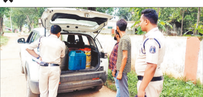
कार की डिकी में रखा डीजल जब करती पुलिस की टीम।