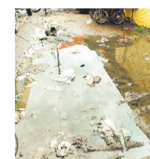
शहर में जगह-जगह जल भरवा।

मनेन्द्रगढ़। पहले गुरुवार फिर शुक्रवार को दोपहर हुई बारिश ने लोगों को उमस भरी गर्मी से राहत दी है। जिले में मानसून की इतनी सक्रियता बढ़ने से किसानों के चेहरे खिल उठे हैं। बारिश का पानी खेतों में भरने से धान की रोपणी भी शुरू हो गया है। मानसून की झमाझम बारिश से किसान काफी खुश हैं। वे लंबे समय से मानसून की बारिश का इंतजार कर रहे थे। कहीं-कहीं जैसे जगह जहां धान के थरहा तैयार हैं, वहां रोपाई का कार्य भी शुरू हो गया है।