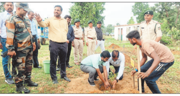
पौधरोपण करते कलेक्टर व अन्य।

मनेन्द्रगढ़। प्रधानमंत्री नरेंद्र मोदी ने विश्व पर्यावरण दिवस के अवसर पर एक पेड़ मां के नाम अभियान का शुभारंभ किया। प्रधानमंत्री श्री मोदी ने दिल्ली के बुद्ध जयंती पार्क में एक पीपल का पेड़ लगाया। उन्होंने सभी देशवासियों से हमारे ग्रह को बेहतर बनाने में योगदान देने का अपील किया है और कहा कि पिछले दशक में भारत ने कई सामूहिक प्रयास किए हैं, जिनसे पूरे देश के वन क्षेत्र में वृद्धि हुई है। आज विश्व पर्यावरण दिवस पर मुझे एक पेड़ मां के नाम अभियान शुरू करने पर बहुत प्रसन्नता हो रही है। मैं देशवासियों के साथ ही दुनियाभर के