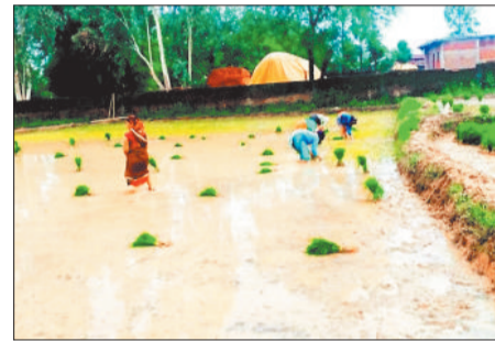
खेती किसानों के कार्य में आई तेजी।