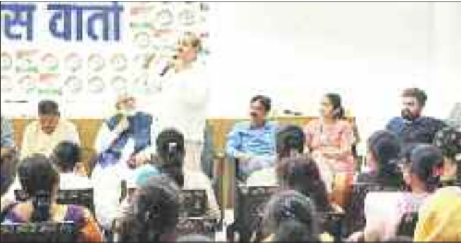
बैठक को संबोधित करते एमआईसी सदस्य।

लगता है कि सत्ताधारी दल के कार्यालय से परिसीमन को लेकर जो प्रस्ताव आया है उसे निगम प्रशासन ने बंद कमरे में सील-मोहर लगाकर स्वीकृति दे दी है। शहर के आबादी के अनुसार वार्डों की आबादी 2610 लोगों की होनी चाहिए किन्तु वार्डों की सीमाओं को बदलने, वार्डों में क्षेत्रों के जोड़ने और थाने के बावजूद आबादी के कॉलम को हटावत कर दिया गया जो आश्चर्यजनक है। एमआईसी